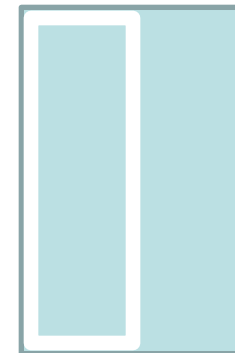
½ Page hauteur H 260mm x L 95mm

*Pas de texte à moins de 3mm des bords de coupe.