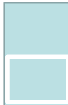
½ page largeur H 120mm x L 220mm